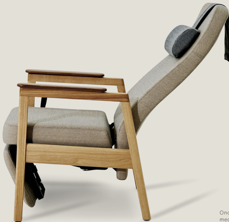
Ono SVF vippet med valnød armlæn.

Ono SVF er udstyret med en synkronisk vippemekanisme, der tillader sæde og ryglæn at bevæge sig i et afstemt forhold, hvilket sikrer en behagelig og glidende vippebevægelse. Reguleringen er trinløs