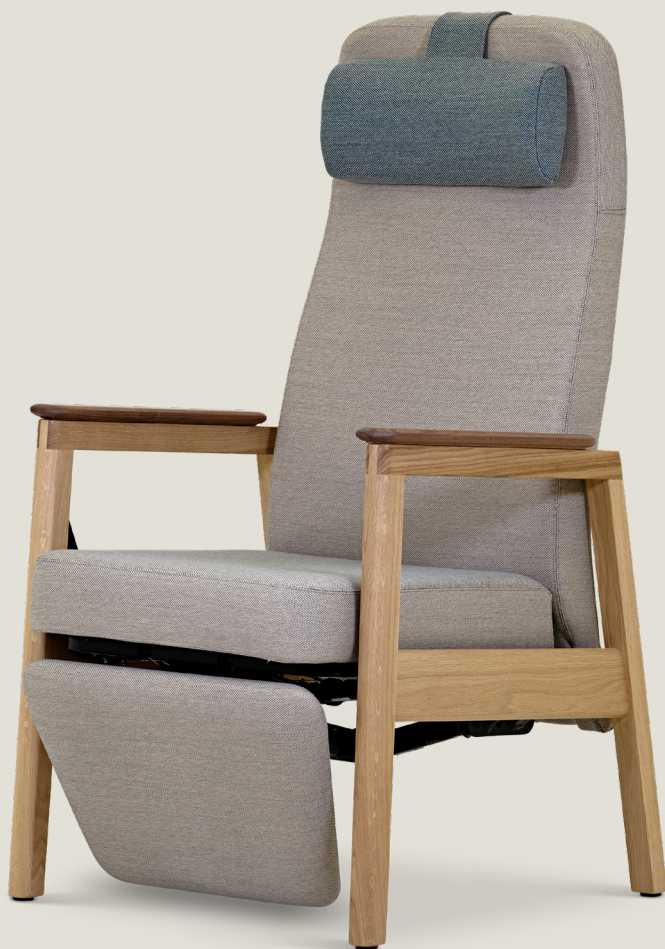
Ono SVF med valnød armlæn.