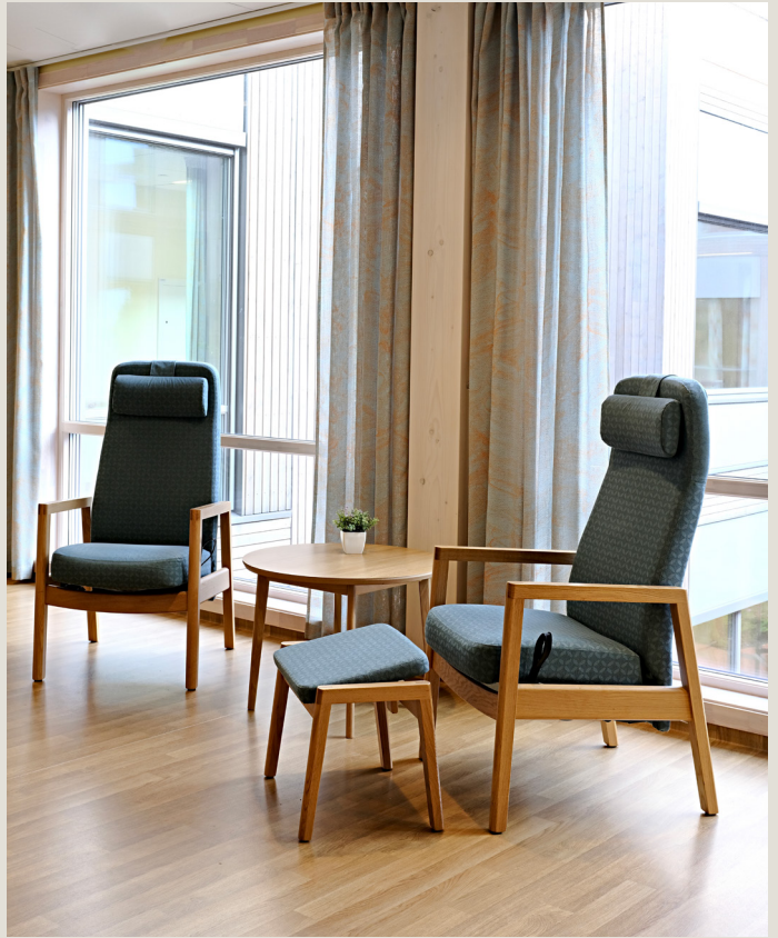
Ono SV på Nygård Plejehjem.

“Vi har valgt Ono til Nygård Plejehjem, fordi vi vidste, at vi ved at vælge netop den ville få et kvalitetsprodukt, leveret sikkert og præcist til aftalt tid. Valget faldt også på Ono, fordi stolen har et enkelt design, som samtidig er enormt komfortabelt for brugeren. Møblerne er slidstærke og produceret på en måde, hvor vores personale ikke skal efterspænde delene. Det betyder også meget for os, at stolen, i dens udførelse, er fleksibel i forhold til tilvalg og fravalg.”